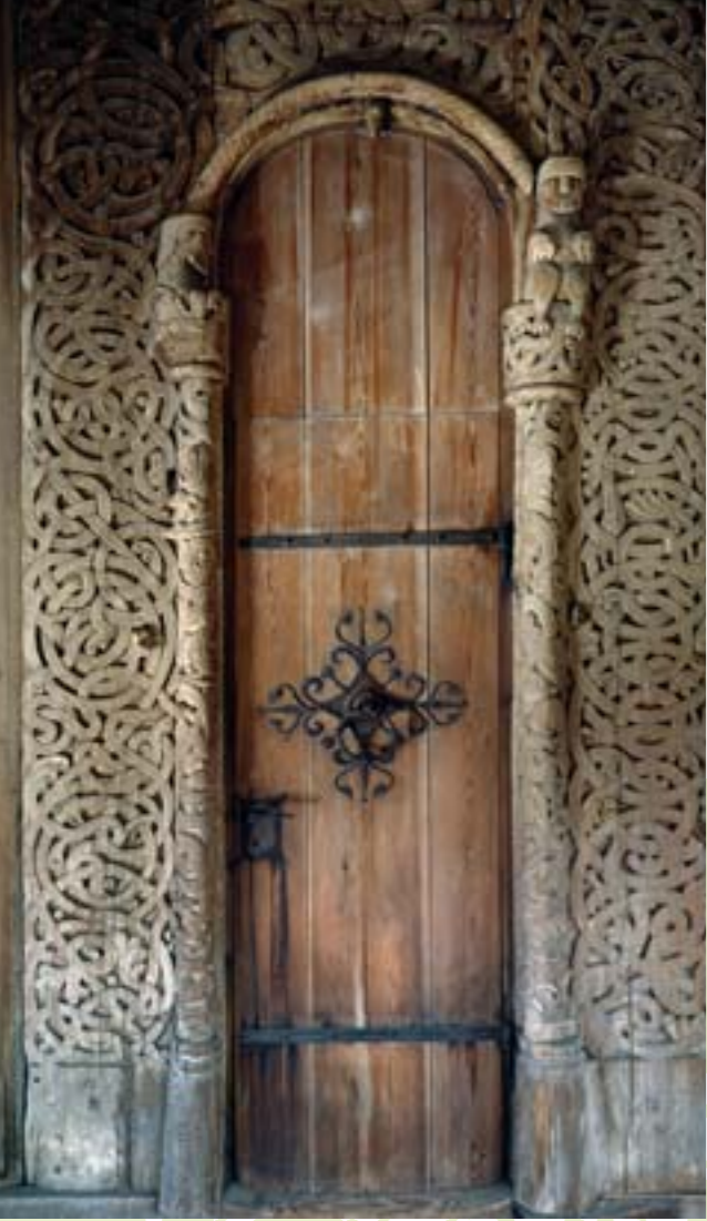
Portal frå Heddal stavkyrkje.