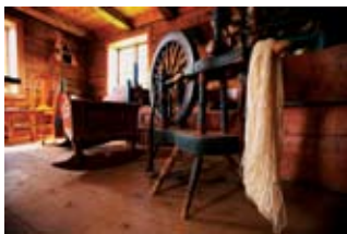
Reiskapsamlinga på Sogn Folkemuseum er blant dei største i landet. Over 30 000 gjenstandar og 40 bygningar er tekne vare på.