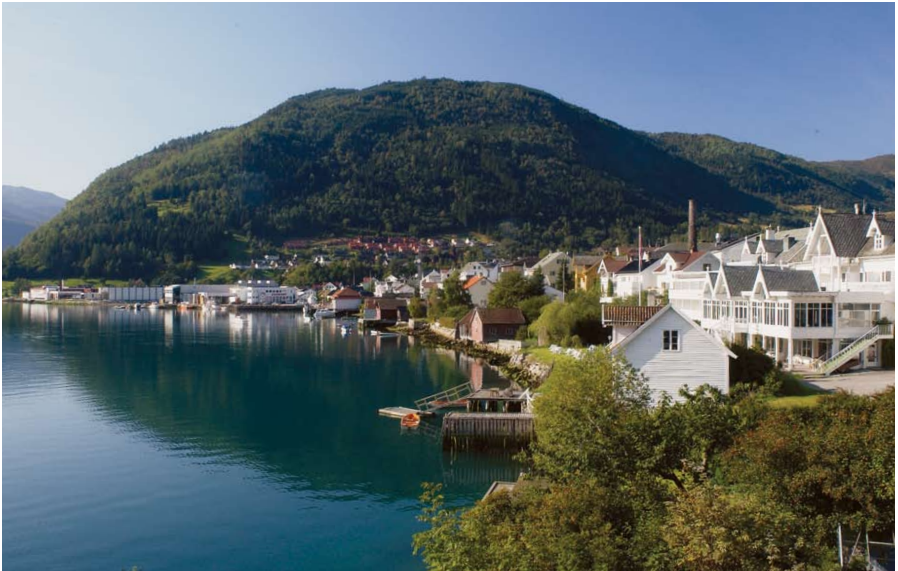
Sogndalsfjøra med Hofslund hotell i framgrunnen.

parar. I folkefantasien blei han Noregs Robin Hood, mannen som stal frå dei rike og gav til dei fattige. Dessutan sjarmerte han kvinner som få andre i landet.