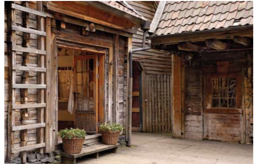
Bak Bryggen kjem vi tilbake til gamle dagar.

«Byfjorden» sa nordlendingane om havstykka, fjordane og sunda langt nord for Bergen, der dei kom seglande i jektene sine som var tungt lasta med tørrfisk. Folk frå Sogn kom med ved i mindre jekter,