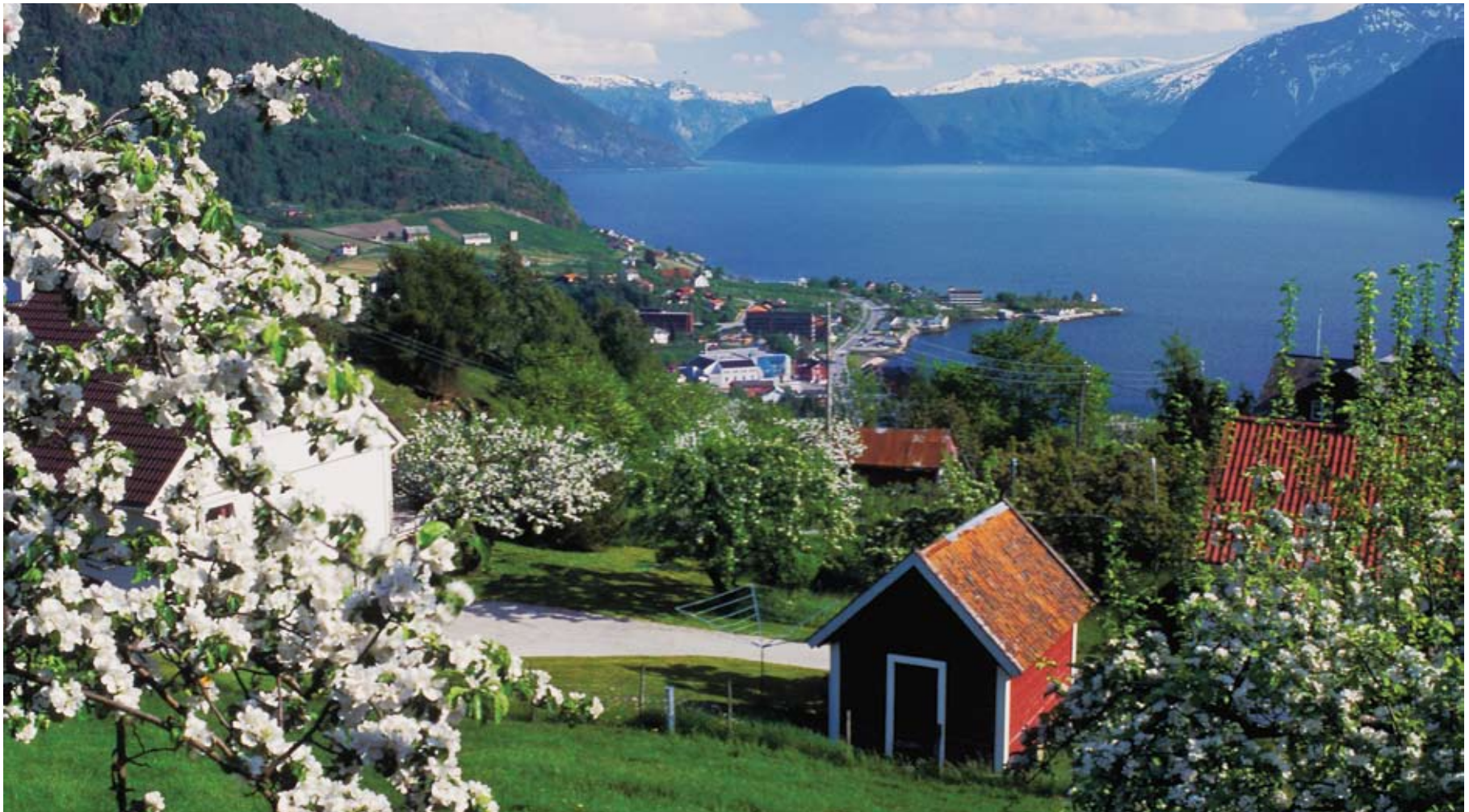
Fruktblomstring i Leikanger.