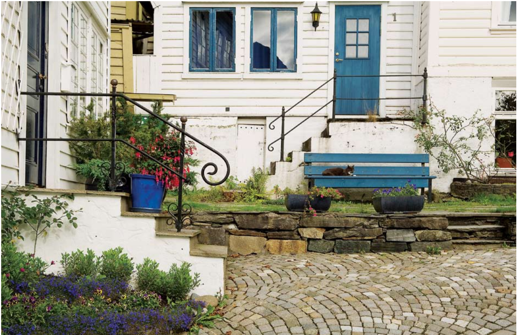
På Nordnes finn vi framleis gamle og intakte bygningsmiljø.

er rimeleg å rekna med at Bergen kan plasserast blant dei byane som voks fram av seg sjølv. Det kan ha vore ein tettstad inst i Vågen på eit par hundre sjeler før Olav Kyrre si kongetid, 1066–1093. Olav Kyrre var den fredsæle kongen som har fått namnet sitt knytt til sjølve grunnleggjinga av byen.